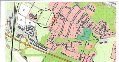
ÜBERSICHTSPLAN zu den Bebauungsplänen (maßstablos) Geobasisdaten: Digitale Topographische Karte DTK 1:0 © GeoBasis-DE/LGB 2018 der Landesvermessung und Geobasisinformation Brandenburg