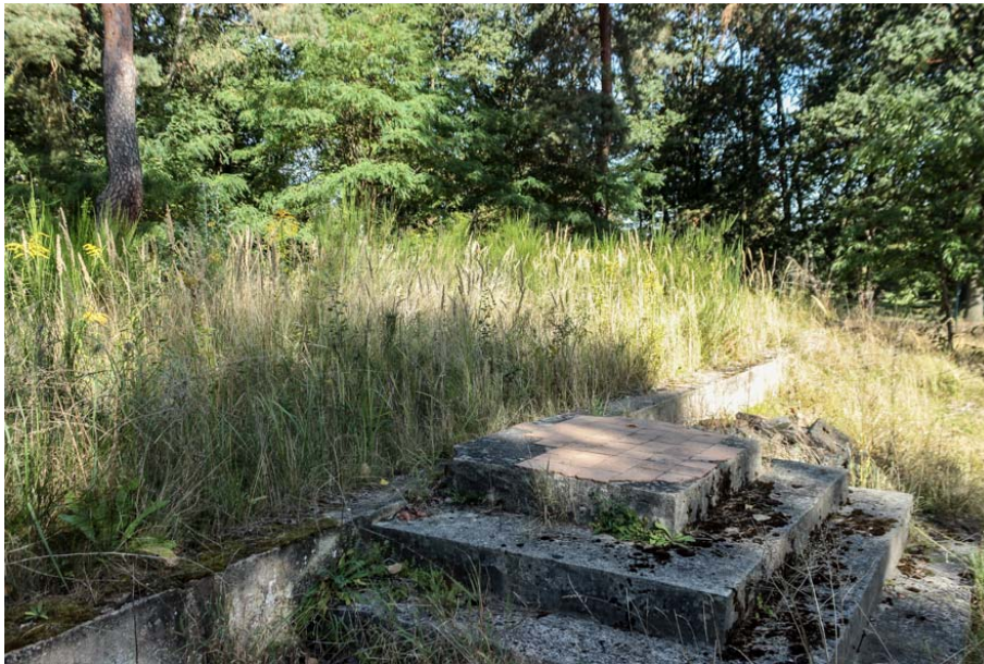
Bild 23: Detailansicht eines stark überwachsenen Fundaments im Norden