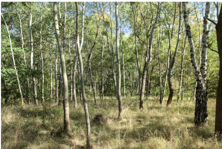
Bild 16: Relativ großflächig ausgebildeter Zitterpappelvorwald im Osten des Gebietes

Als eine typische Art der Vorwälder tritt Zitterpappel ( Populus tremula ) häufig auf, allerdings oft in Kombination mit anderen Gehölzen. Selten herrscht sie auf größerer Fläche vor. In diesen Fällen wird sie dem Biotoptyp zugeordnet.