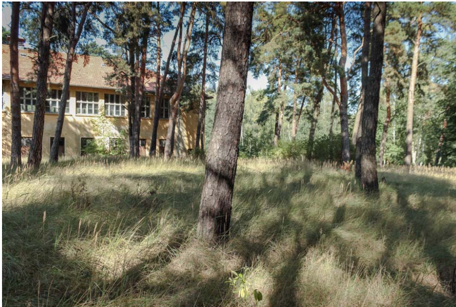
Bild 20: Lichter Bereich mit Altkiefern und Landreitgras im Unterwuchs im Osten des Gebietes