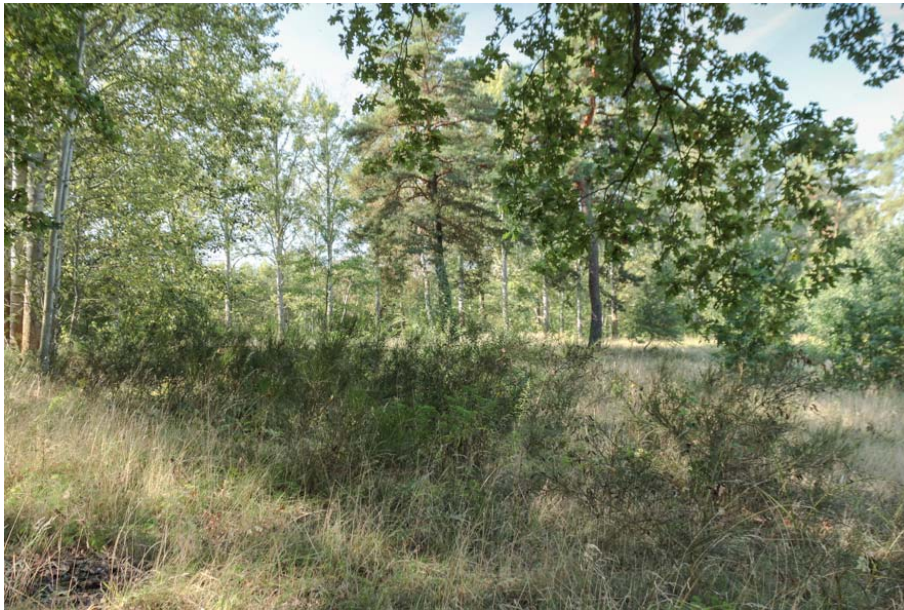
Bild 13: Besenginsterbestand am and einer Gehölzgruppe im nördlichen Teil des Untersuchungsgebietes