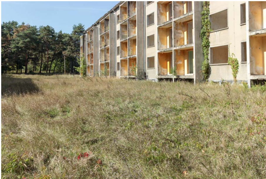
Bild 4: Ruderalflur im Bereich verlassener Wohngebäude im südwestlichen Teil des Untersuchungsgebietes

Im ganzen Untersuchungsgebiet haben sich aufgrund von Nutzungsaufgabe unterschiedliche Ruderalfluren entwickelt. Sie bilden nur kleinflächig Reinformen aus, großflächig immer Mischformen. Es wurde deshalb darauf verzichtet, sie gesondert auszuweisen.