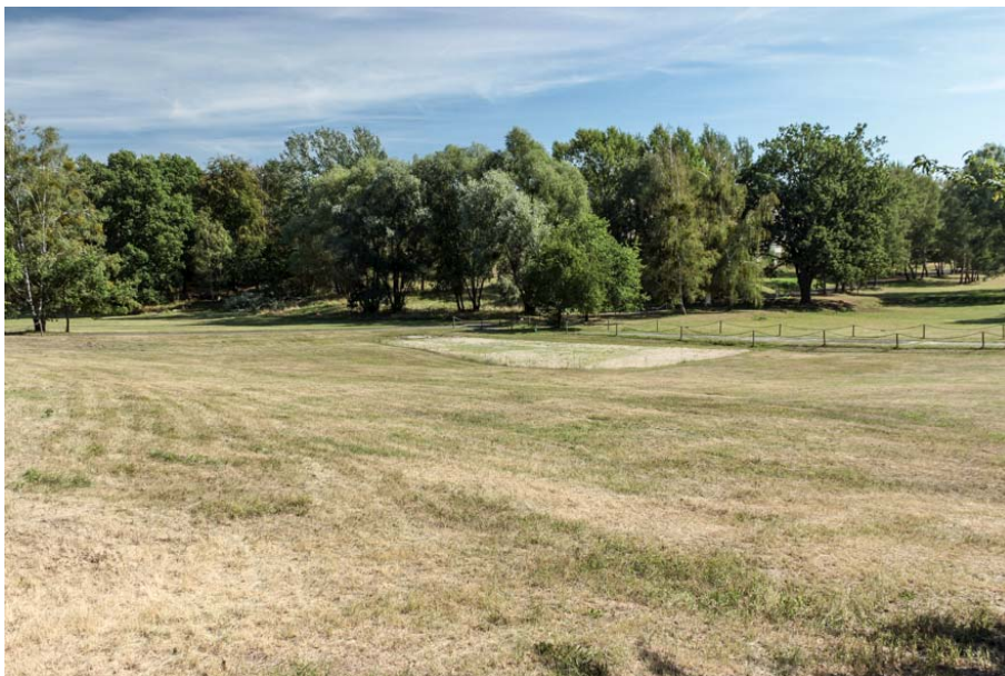
Bild 11: Blick über einen weitflächigen, frisch gemähten Zierrasen im zentralen Bereich des Untersuchungsgebietes

Besonders im nördlichen und zentralen Teil des Untersuchungsgebietes befinden sich regelmäßig gemähte Bereiche mit relativ artenarmen Scherrasen. Sie werden häufig von verschiedenen Gräsern wie Rotstraußgras ( Agrostis tenuis ), Schafschwingel ( Festuca ovina agg.), Rotschwingel ( Festuca rubra agg.) gebildet. Bei Tritteinfluß können sie lückig ausgebildet sein. Zerstreut sind weitere Arten wie Schafgarbe ( Achillea millefolium ), Graukresse ( Berteroa incana ), Pippau ( Crepis tectorum ), Fingerkraut ( Potentilla arenaria ), Wolfsmilch ( Euphorbia cyparissias ) und Wegerich ( Plantago lanceolata et P. major ) regelmäßig beigemischt. Mitunter sind auch Ruderalarten vertreten.