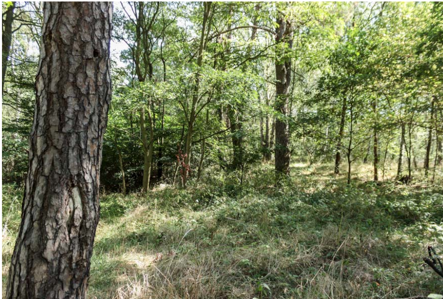
Bild 18: Blick in einen lichten Abschnitt des Waldes mit starkem Brombeerbewuchs in der Krautschicht