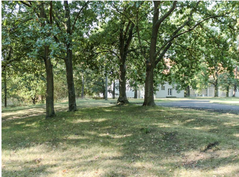
Bild 12: Zierrasen mit Eichenbaumgruppe in der nördlichen Hälfte des Untersuchungsgebietes

Unter dieser Kategorie werden die mit Bäumen überschirmten, vorhergehend beschriebenen Zierrasen aufgeführt.