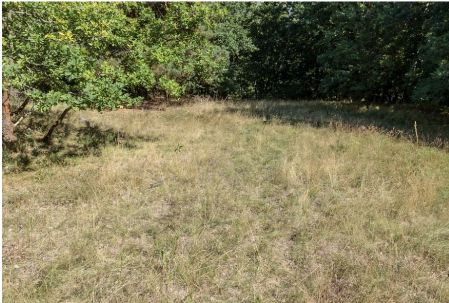
Bild 10: Von verschiedenen Gräsern geprägter Sandtrockenrasen am Waldrand