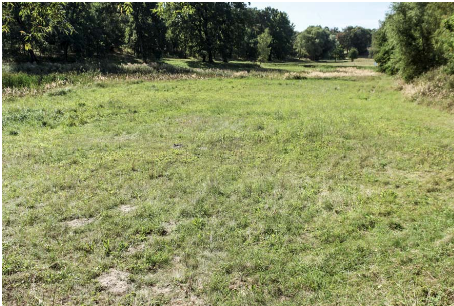
Bild 9: Blick in südwestliche Richtung über die kürzlich gemähte Wiese. Im Hintergrund ist ein ungemähter Landreitgrasbestand (hell) zu erkennen

Im Bereich des Kleingewässers befindet sich in einer Art Senke ein zum Untersuchungszeitpunkt in Teilen kürzlich gemähtes Grünland. Es setzt sich neben typischen Grünlandarten wie Knaulgras ( Dactylis glomerata ), Ehrenpreis ( Vernica chamaedrys ) Wicke ( Vicia cracca ) und Wilder Möhre ( Daucus carota ) auch aus zahlreichen Ruderalarten zusammen. Typische Vertreter sind Rainfarn ( Tanacetum vulgare ), Landreitgras ( Calamagrostis epigejos ) und Quecke ( Elytrigia repens ).