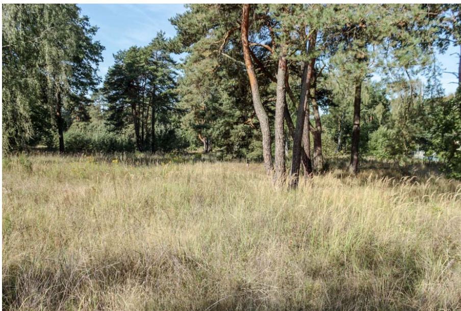
Bild 8: Landreitgrasbestand im Nordwesten teilweise von Gehölzen überschirmt