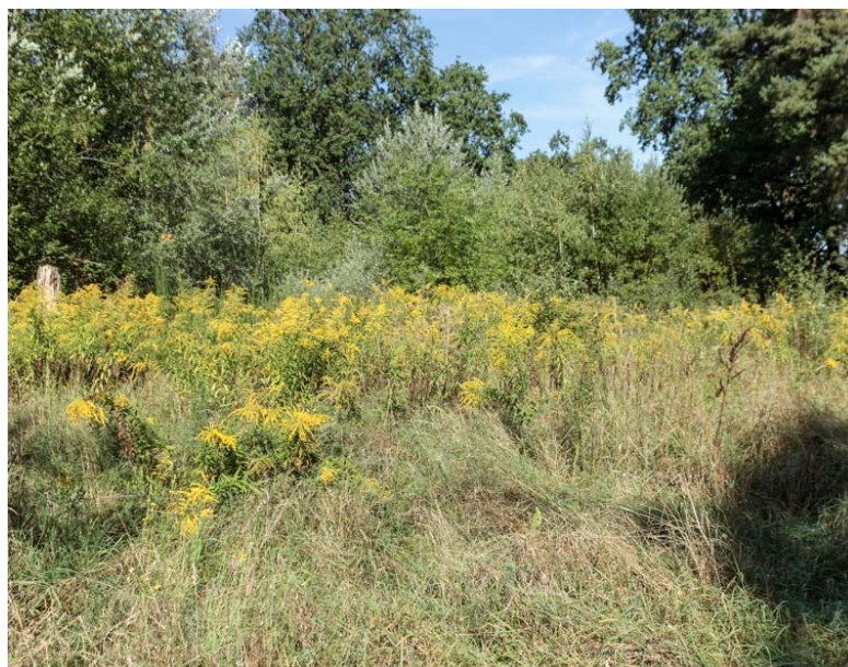
Bild 5: Kleinflächiger Bestand von Goldrute im Nordwesten des Gebietes