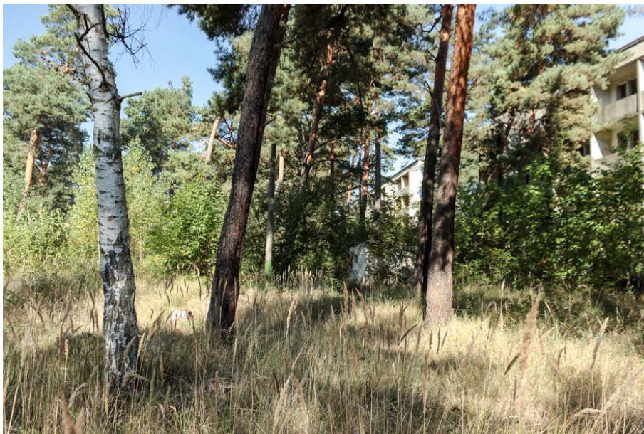
Bild 17: Kleine Vorwaldfläche im Bereich einer ehemaligen Siedlung. Neben Altkiefern sind Birken und Zitterpappeln beteiligt. Der Unterwuchs besteht vor allem aus Landreitgras

Häufige Arten sind Robinie ( Robinia pseudoacacia ), Birke ( Betula pendula ), Ahorn ( Acer platano-ides , A. negundo et A. pseudoplatanus ) und Pappeln ( Populus tremula et P. alba ). Teilweise sind auch Kulturrelikte wie Flieder ( Syringa vulgaris ) und Schneebeere ( Symphoricarpos albus ) am Aufbau beteiligt. Der Unterwuchs ist nahezu ausschließlich ruderal und setzt sich aus den auf S. 8 beschriebenen Arten zusammen. Stellenweise sind auch Altbäume enthalten (s. Bild 17).