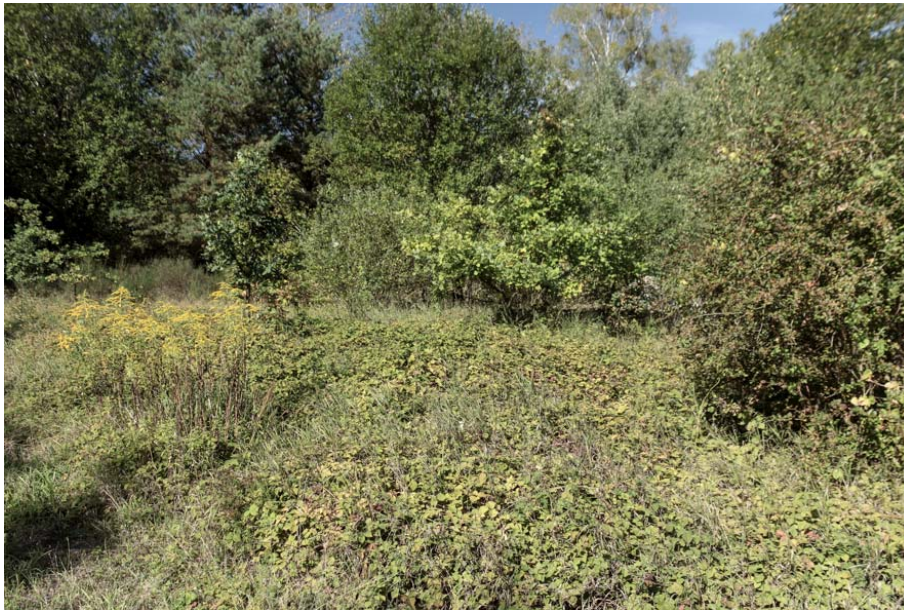
Bild 7: Ruderalflur mit aufwachsenden Gehölzen im nordwestlichen Teil des Untersuchungsgebietes. Im Vordergrund ist starker Aufwuchs von Kratzbeere erkennbar