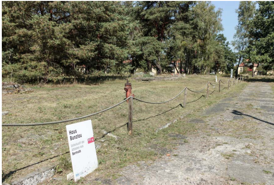
Bild 21: Blick auf Fundamente ehemaliger Unterkünfte mit Informationstafel