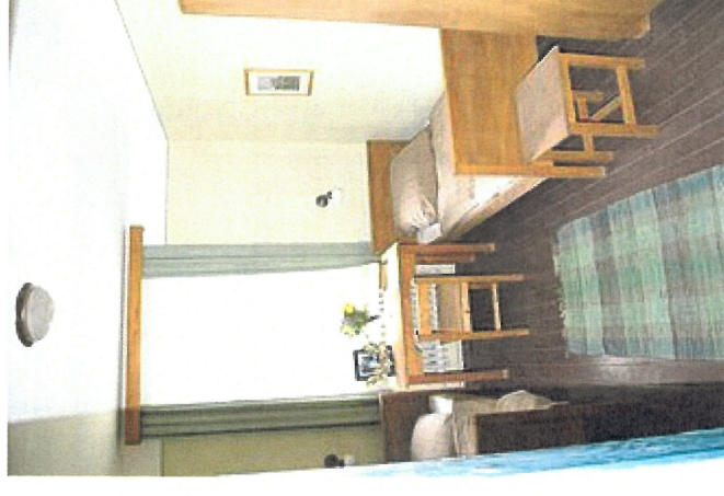
Im olympischen Dorf rekonstruiertes Zimmer von Jesse Owens (2007)

“When I passed the Chancellor he arose, waved his hand at me, and I waved back at him. I think the writers showed bad taste in criticizing the man of the hour in Germany.”