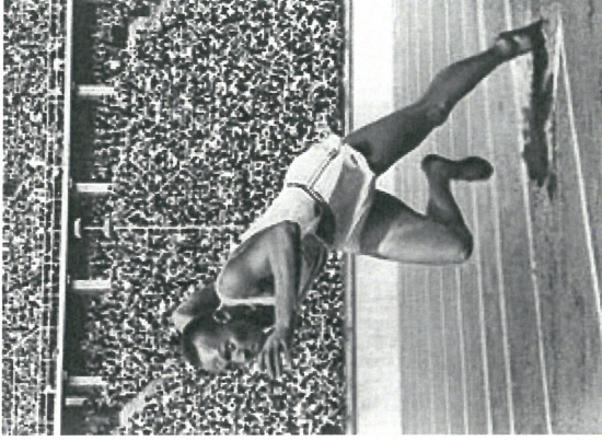
Owens beim Start zum 200-Meter-Lauf im Olympiastadion Berlin 1936