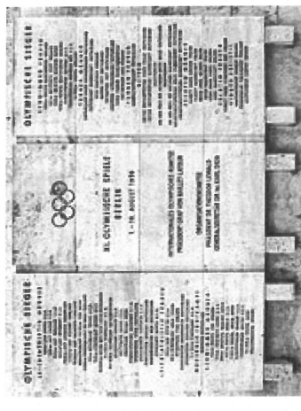
Gedenktafel am Olympiastadion Berlin, in Berlin-Westend