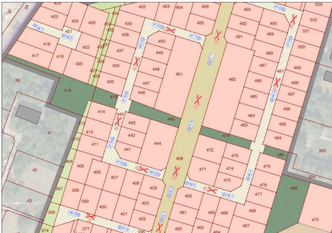
Abb.: geänderte "Höhenbezugspunkte"

Zudem wurden die Höhenbezugspunkte nicht mehr in Zentimetern (cm) sondern Dezimetern (dm) (mathematisch gerundet) festgesetzt.