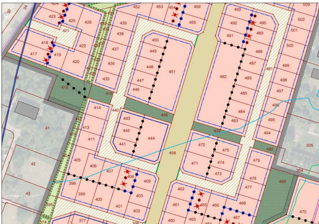
Abb.: geänderte "Knödellinien"

Wie im Pkt. 5.1 dargelegt, sind im Plangebiet neue Parzellen und Flurstücke gebildet worden. Im Übergang zwischen dem BG 1 und dem BG 2 sind die an der Planstraße B - jetzt Heiderlerchenallee - gelegenen neuen Baugrundstücke abweichend von den bisherigen "Knödellinien" gebildet worden. Die Grenzen zwischen unterschiedlichen Bauweisen sollen an die Neuparzellierung angepasst werden, um den Vollzug des Bebauungsplanes zu vereinfachen und nur eine Bauweise je Baugrundstück anwenden zu müssen.